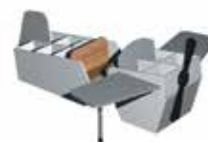
Blanc pur [1]