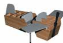
Mélangine olivier [4]

Remplacez, s.v.p., le dernier chiffre de la référence par le chiffre indicateur du coloris.