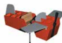
Rouge feu [2]