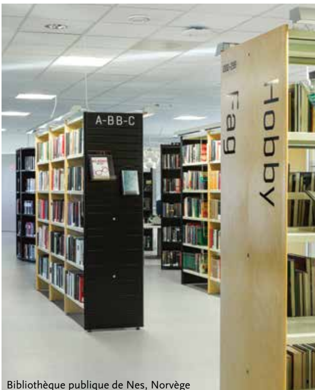
Bibliothèque publique de Nes, Norvège

Voici quelques exemples de projets réalisés avec le système de rayonnage Softline. Rendez-vous sur www.sbnl.be pour découvrir d'autres photos d'aménagements inspirants.