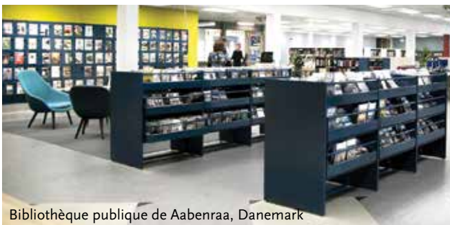
Bibliothèque publique de Aabenraa, Danemark

Voici quelques exemples de projets réalisés avec le système de rayonnage Frontline. Rendez-vous sur www.sbnl.be pour découvrir d'autres photos d'aménagements inspirants.