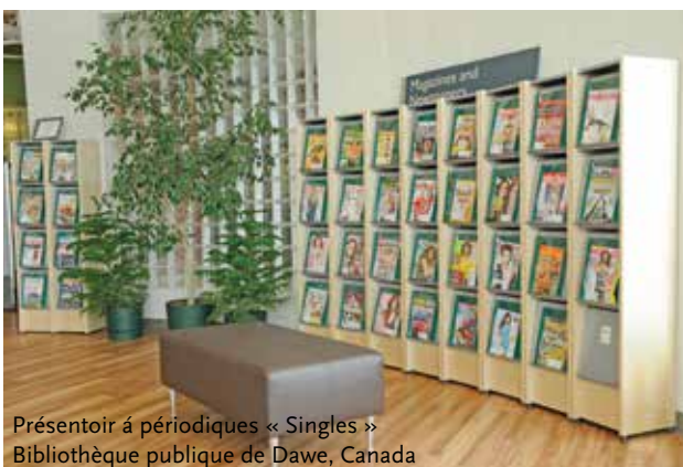
Présentoir à périodiques « Singles » Bibliothèque publique de Dawe, Canada