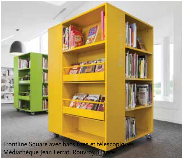
Frontline Square avec bacs fixes et télescopiques Médiathèque Jean Ferrat, Rouvroy, France