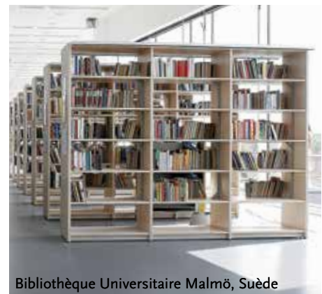
Bibliothèque Universitaire Malmö, Suède