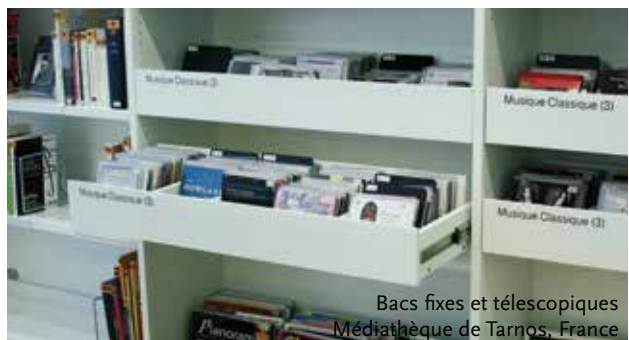
Bacs fixes et télescopiques Médiathèque de Tarnos, France