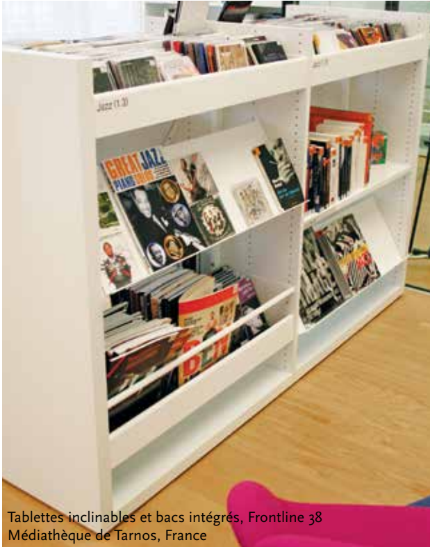
Tablettes inclinables et bacs intégrés, Frontline 38 Médiathèque de Tarnos, France