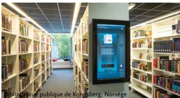
Bibliothèque publique de Kongsberg, Norvège