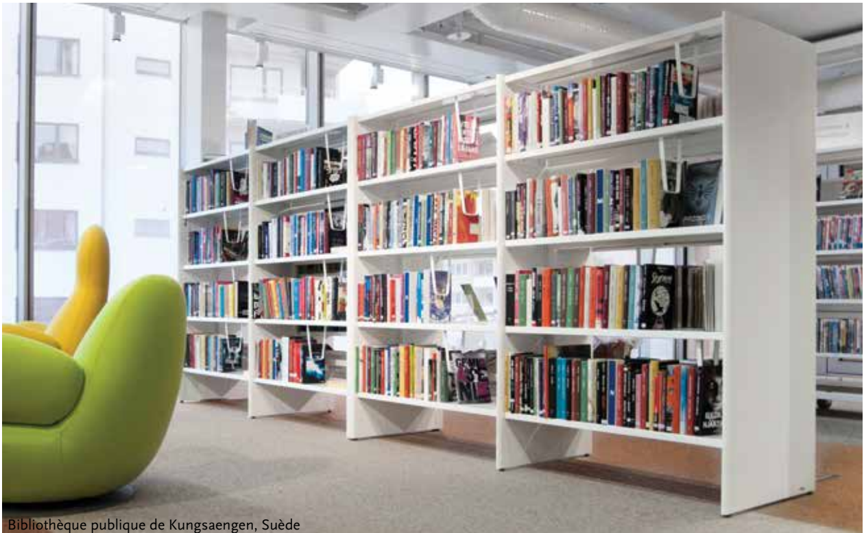
Bibliothèque publique de Kungsaengen, Suède