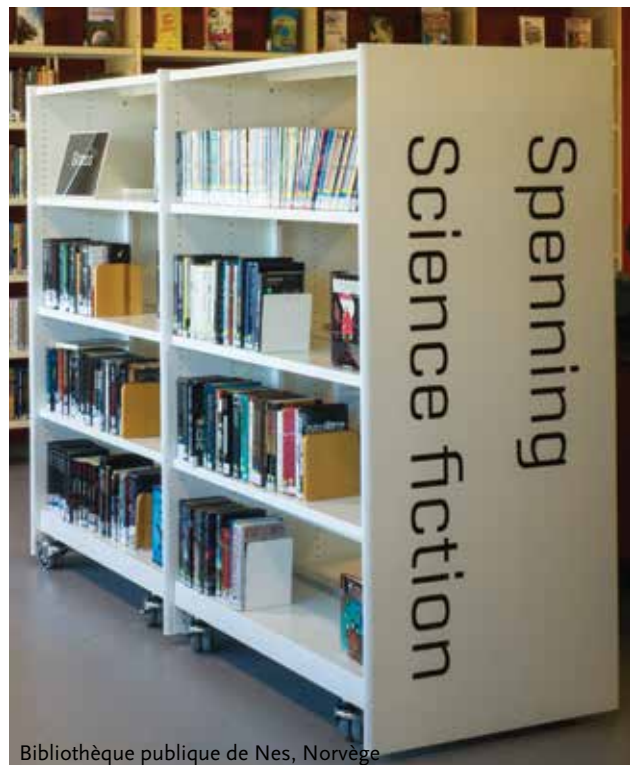
Bibliothèque publique de Nes, Norvège