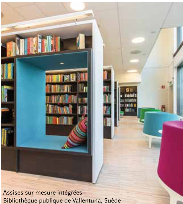
Assises sur mesure intégrées Bibliothèque publique de Vallentuna, Suède

Nos concepts de bibliothèque garantissent des expériences uniques aux utilisateurs. Ils s'appuient, d'une part, sur une gamme standard de produits de qualité supérieure et d'autre part, sur l'élaboration permanente de nouvelles solutions personnalisées afin de répondre à l'évolution des besoins en bibliothèque.