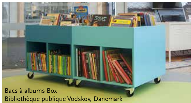
Bacs à albums Box Bibliothèque publique Vodskov, Danemark