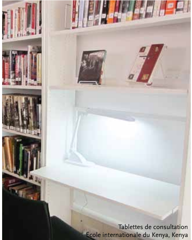
Tablettes de consultation École internationale du Kenya, Kenya