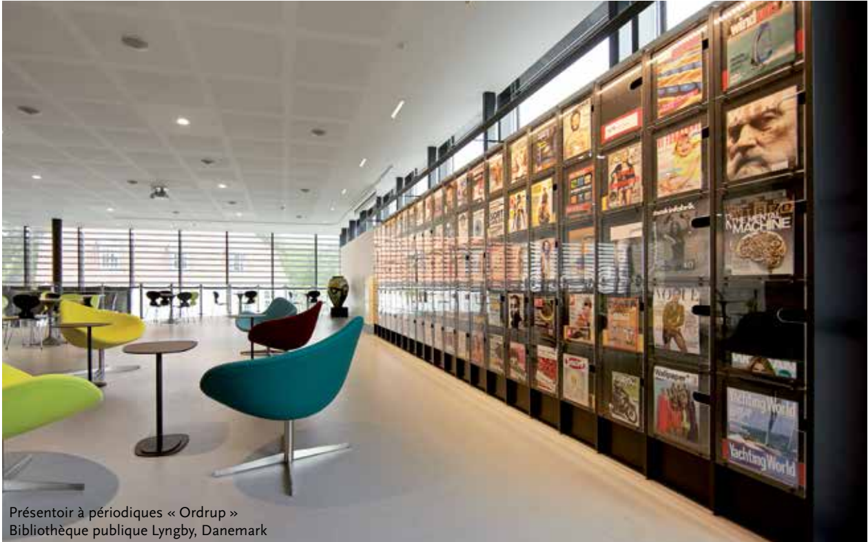
Présentoir à périodiques « Ordrup » Bibliothèque publique Lyngby, Danemark