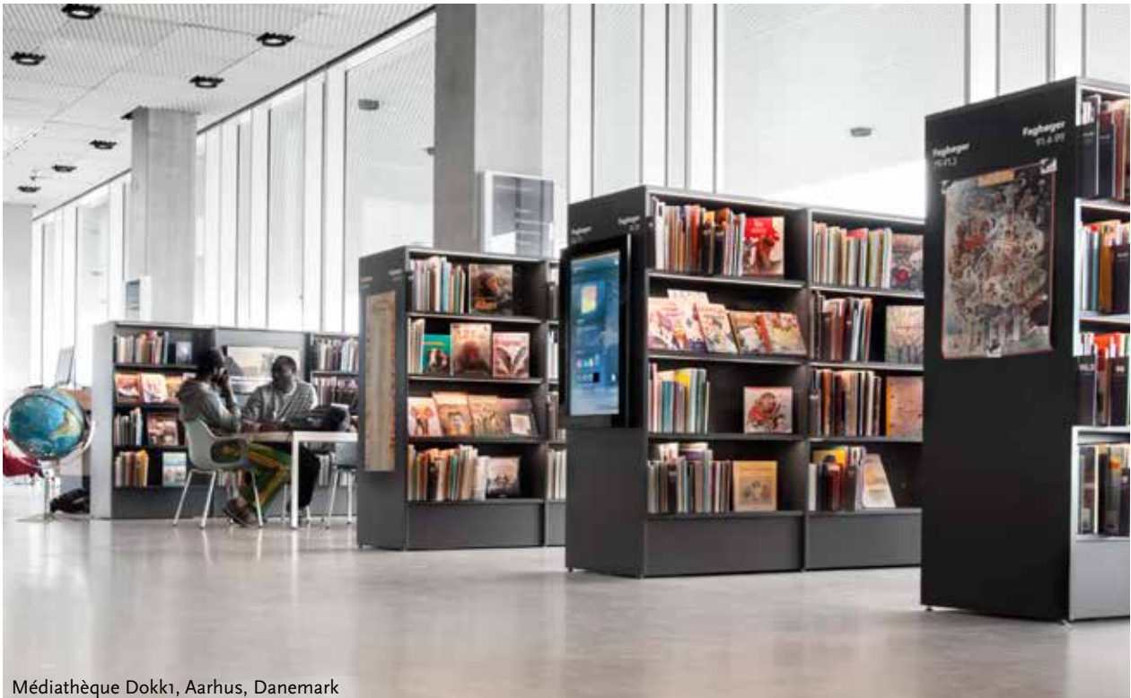
Médiathèque Dokk1, Aarhus, Danemark