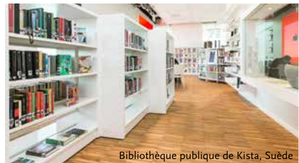
Bibliothèque publique de Kista, Suède