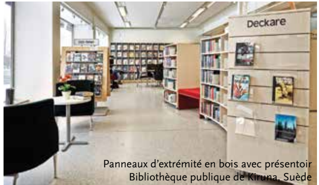
Panneaux d'extrémité en bois avec présentoir Bibliothèque publique de Kiruna, Suède