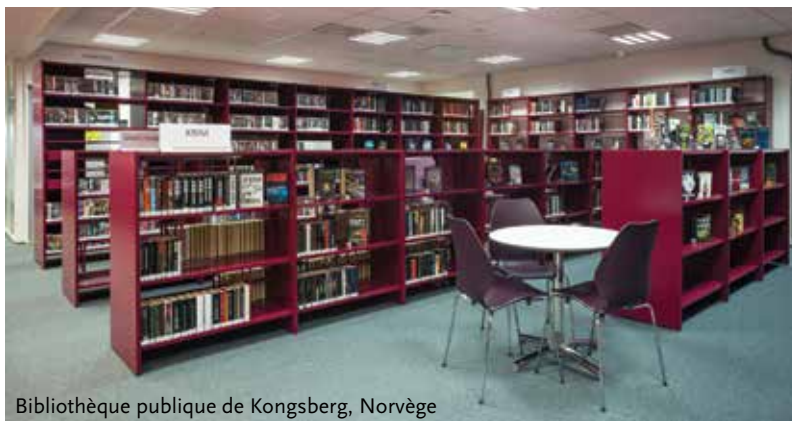
Bibliothèque publique de Kongsberg, Norvège

Voici quelques exemples de projets réalisés avec le système de rayonnage Slimline. Rendez-vous sur www.sbnl.be pour découvrir d'autres photos d'aménagements inspirants.