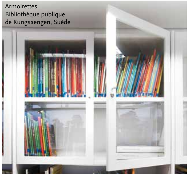
Armoirettes Bibliothèque publique de Kungsaengen, Suède