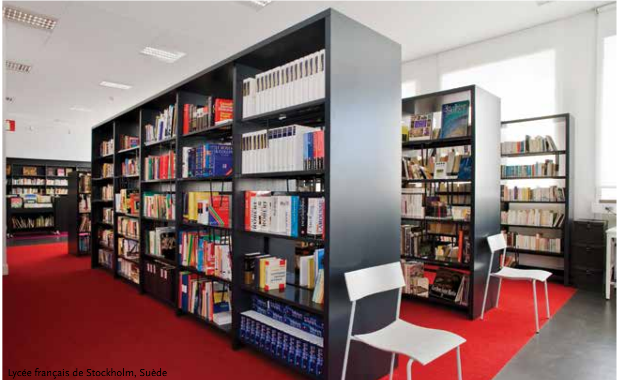
Lycée français de Stockholm, Suède