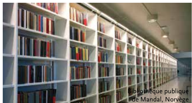
Bibliothèque publique de Mandal, Norvège