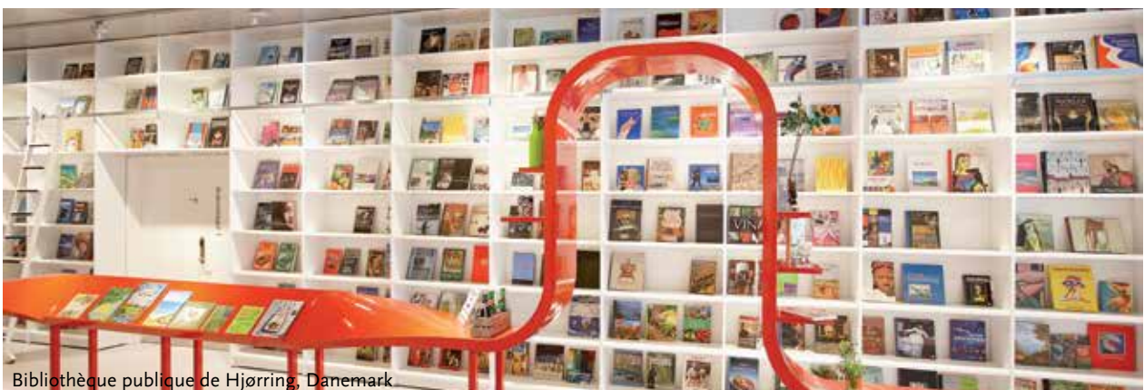
Bibliothèque publique de Hjørring, Danemark