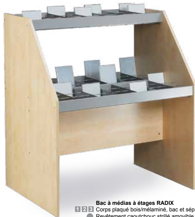
Bac à médias à étages RADIX 1 2 3 Corps plaqué bois/méla miné, bac et séparations métal laqué. ● Revêtement caoutchouc strillé amovible, tiges métalliques et 18 séparations pour environ 630 CDs compris, hauteur du bac 80 mm. L 1128 mm, P 760 mm, H 1280 mm

Le bac en métal et les cotés en bois font un ensemble intéressant, et la présentation frontale offre une vue d'ensemble idéale pour pouvoir trouver plus rapidement ce qu'on cherche. Les séparations sont variables, ce qui donne la possibilité de ranger également des cassettes vidéo et des DVD. Les tiges métalliques servent à tenir les médias, même si les bacs ne sont pas remplis. Les unités de base et les annexes permettent un enchaînement des bacs à médias.