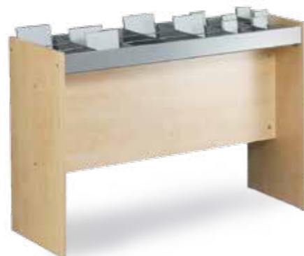
Bac à médias double face RADIX 1 2 3 Corps plaqué bois/méla miné, bac et séparations métal laqué. ● Revêtement caoutchouc strillé amovible, tiges métalliques et 12 séparations pour environ 420 CDs compris, hauteur du bac 80 mm L 1128 mm, P 765 mm