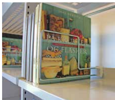
Modèle standard, profondeur de la tablette : 30 cm

Exemples de différentes versions du serre-livres sur la butée arrière :