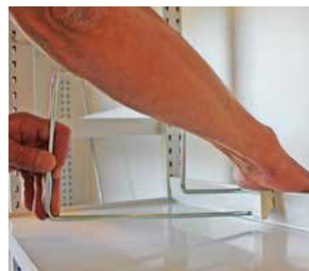
Pressez jusqu'à ce que la fixation soit fermement apposée (vous entendrez alors un « clic »)