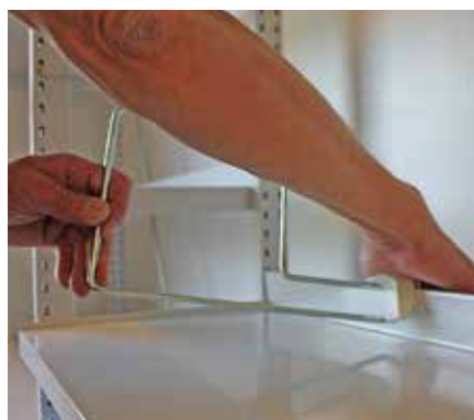
Appuyez avec la paume de la main