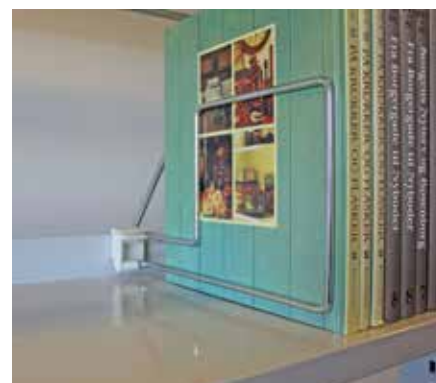
Modèle inversé, profondeur de la tablette : 30 cm