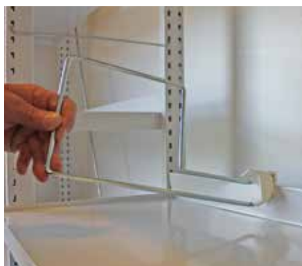
Posez la fixation en plastique sur la butée arrière

Le serre-livres doit être monté sur la butée arrière de la tablette en posant la fixation en plastique sur la butée arrière et en appuyant avec la paume de la main jusqu'à ce qu'elle soit fermement apposée.