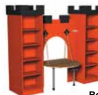
Rouge feu [2]