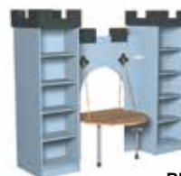
Bleu acier [3]