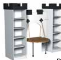
Blanc pur [1]