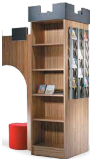
L'illustration montre 3 présentoirs à CD.