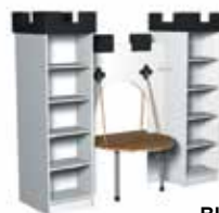
Blanc pur [1]

Service de signalétique Schulz sur demande