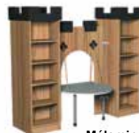
Mélamine olivier [4]