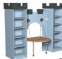
Ble acier [3]