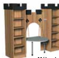
Mélangé olivier [4]

Remplacez, s.v.p, le dernier chiffre de la référence par le chiffre indicateur du coloris.