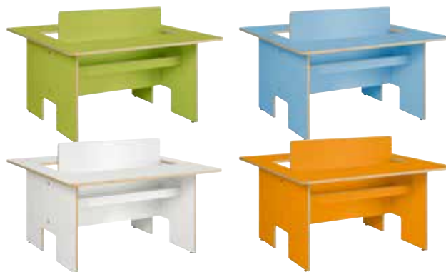
Table d'enfants Plus

Bac à albums avec six compartiments et cinq diviseurs réglables et amovibles. Pieds réglables et tapis en caoutchouc inclus. Les roulettes peuvent être commandées séparément. Capacité: +/- 80 BD