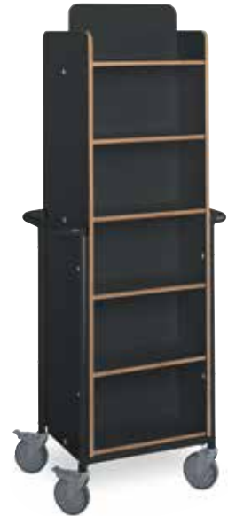
XL PLUS EXHIBITION

Un chariot simple face fonctionnel à trois étagères inclinées fixes offrant une profondeur et un espace de rangement généreux. Capacité env. 100 volumes normaux. Format L1010 x P430 x H1090 mm.