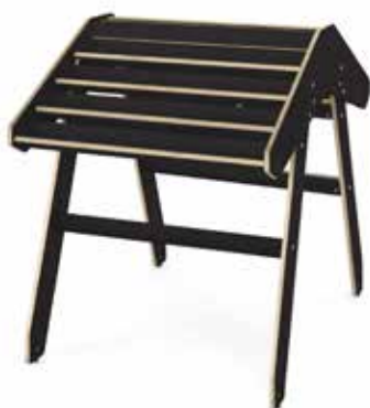
Table autonome Boomerang Plus, noire ou blanche

Table de présentation double face pour exposer de face des livres ordinaires. Espace permettant la superposition de deux tomes. Capacité env. 100 livres ordinaires.