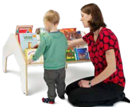
Table de présentation double face pour exposer de face des livres ordinaires. Espace permettant la superposition de deux tomes. Capacité env. 100 livres ordinaires.