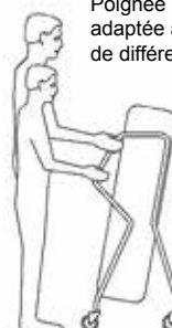
Chariot à livres « Transversal »

Poignée ergonomique adaptée à des utilisateurs de différentes tailles.